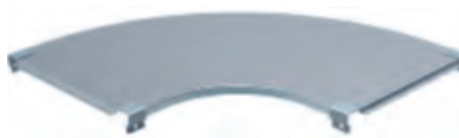
* Sauf largeur 50 R=20 mm

H25 : - 2 points de fixation et 1 point optionnel sur le fond jusqu'à la largeur 300 mm incluse