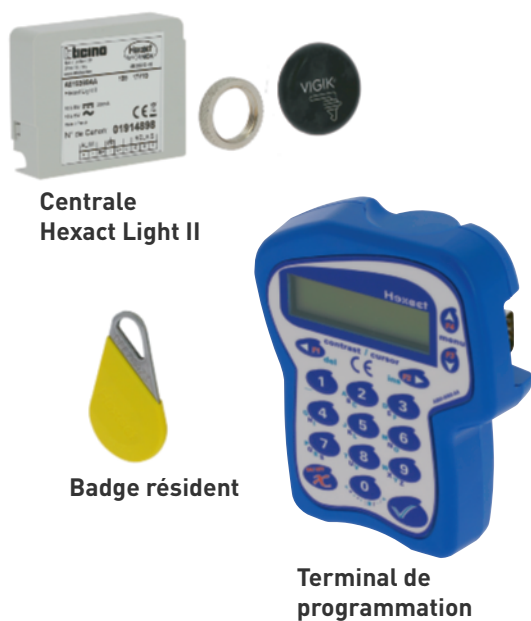
Centrale Hexact Light II