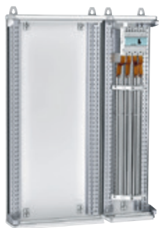
Barres en C réf. 4 044 30 + supports réf. 4 044 50 + kit de raccordement réf. 4 044 53