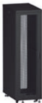
4 468 00