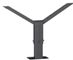
4 468 82