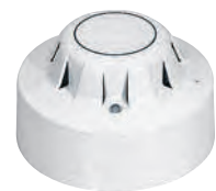
0 405 11

Tableau de choix boîtes, supports et plaques p. 928-929