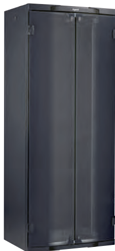
0 463 41