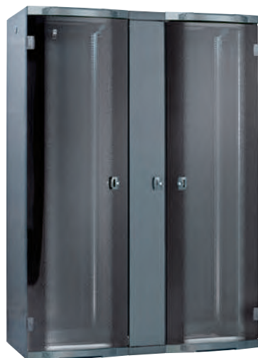
1 baie 0 463 18 + 0 463 34 + 1 baie d'extension 0 463 30