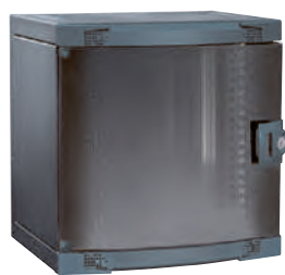
0 462 20