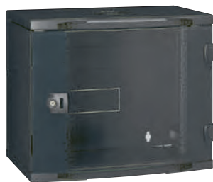
0 462 01