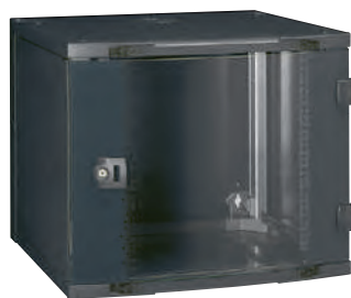
0 462 11