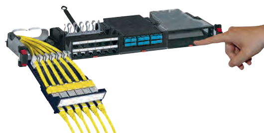
0 337 55 équipée de connecteurs, de câbles et de cordons