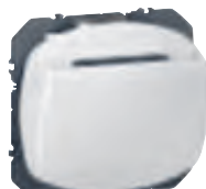
6 000 33