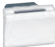
0 784 45