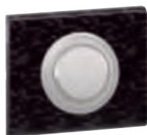
0 670 68 + enjoliveur + plaque Cuir Pixel 0 694 51