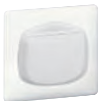
0 675 64 + enjoliveur + plaque Blanc 0 666 31