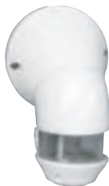
0 489 33

Tableau de choix p. 982 Tableau de charges p. 992