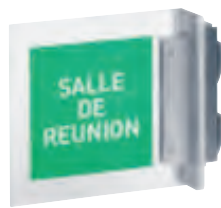
6 530 80 (livré sans étiquette)