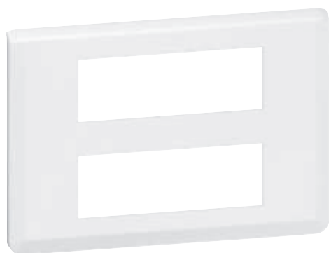
0 788 36L