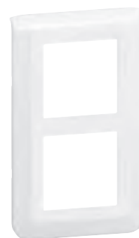
0 788 54L

Tableau de choix boîtes, supports et plaques p. 928-929 Tableau de suggestion d'installation des prises et supports d'installation p. 922