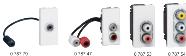
Tableau de choix boîtes, supports et plaques p. 928-929 Exemples d'installation catalogue en ligne