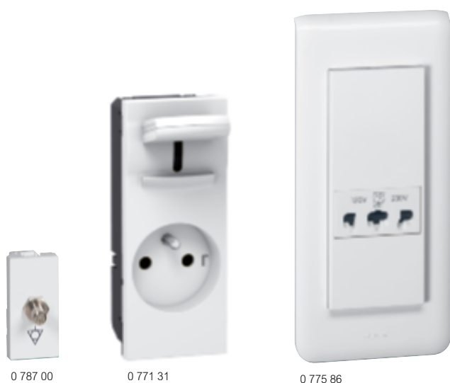
Tableau de choix boîtes, supports et plaques p. 928-929