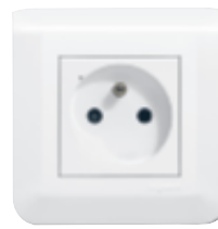
0 777 34L