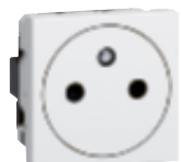
0 771 11L