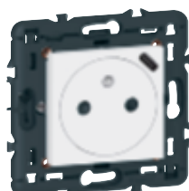
0 771 61L