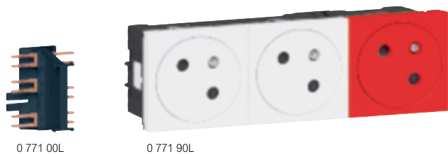
Tableau de choix boîtes, supports et plaques p. 928-929 Tableau de suggestion d'installation des prises et supports d'installation p. 922

Pour pose dans boîtes de sol, colonnes, colonnettes, blocs bureau, goulottes et boîtes d'encastrement prof. 50 mm recommandée