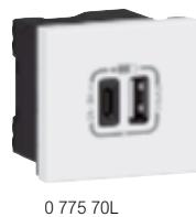
Tableau de choix boîtes, supports et plaques p. 928-929 Tableau de suggestion d'installation des prises et supports d'installation p. 922

Pour pose dans boîtes de sol, colonnes, colonnettes, blocs bureau, goulottes et boîtes d'encastrement prof. 50 mm recommandée Connexion latérale par bornes automatiques bi-stables