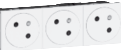
0 771 43L

Tableau de choix boîtes, supports et plaques p. 928-929 Tableau de suggestion d'installation des prises et supports d'installation p. 922