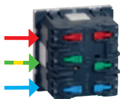
Raccordement latérale avec bornes automatiques bi-stables