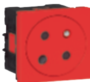
0 771 70L