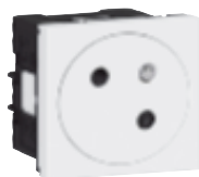
0 771 45L