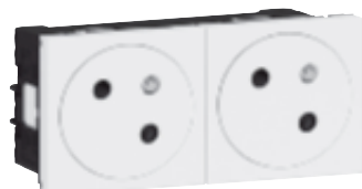
0 771 42L + 0 771 00L + 0 771 45L