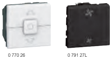
0 770 26