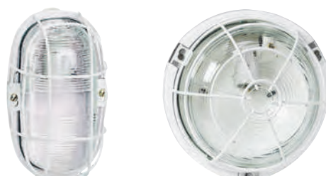
0 604 77 + 0 605 08

pour lieux publics ou environnements sévères