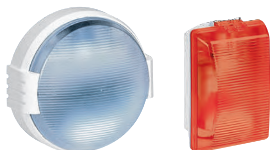
0 624 27