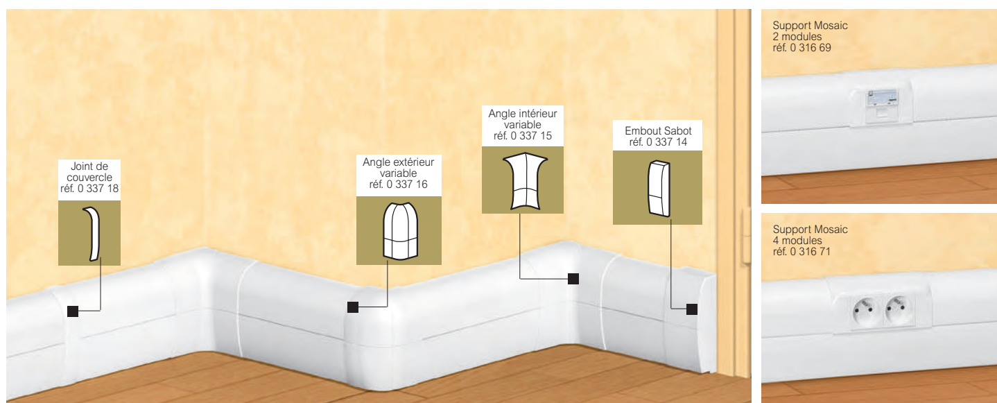
Tableau de choix p. 760 à 763

profilé, accessoires de cheminement et montage d'appareillage