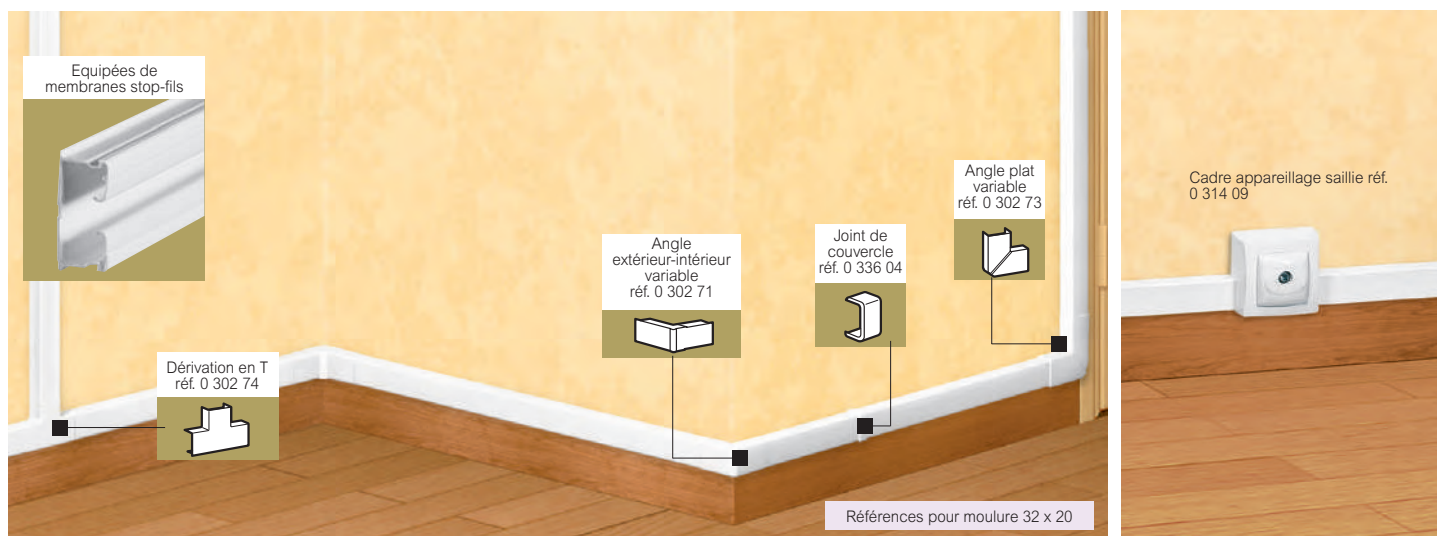
Tableau de choix p. 760 à 763

profilés, accessoires de cheminement et montage d'appareillage