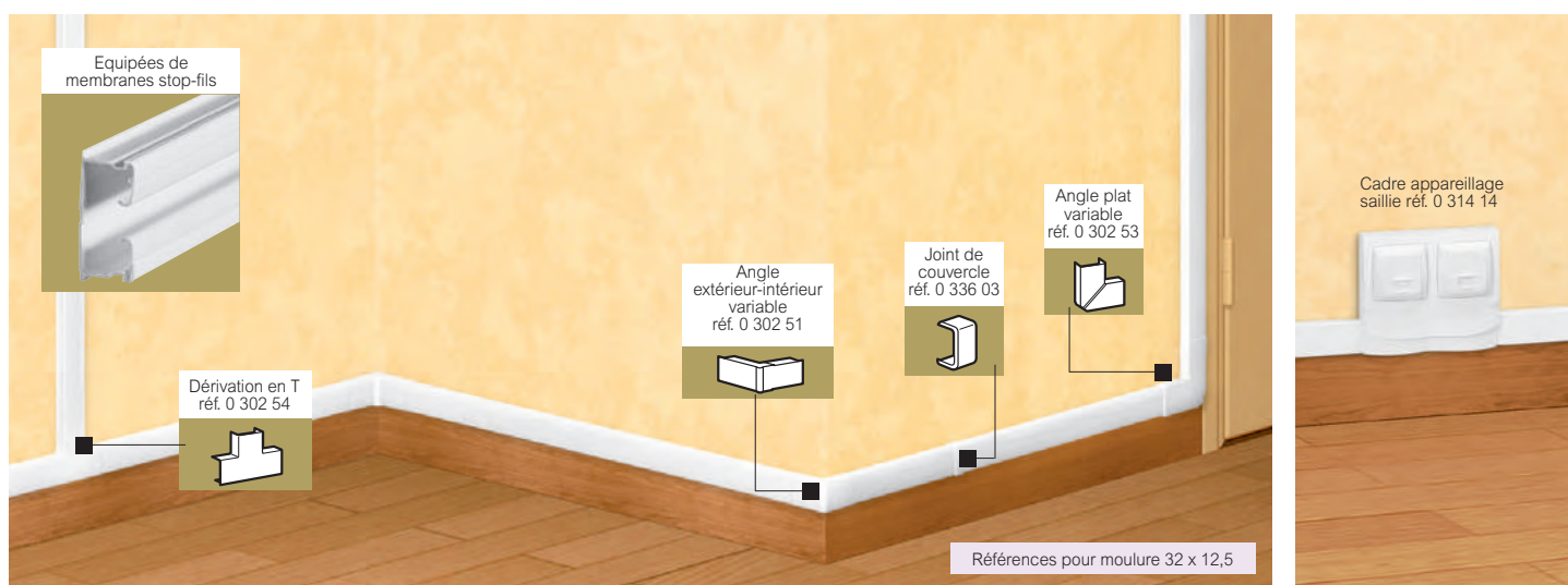
Tableau de choix p. 760 à 763

profilés, accessoires de cheminement et montage d'appareillage