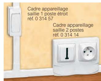
Tableau de choix p. 760 à 763