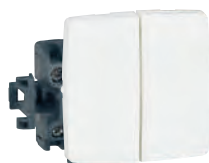
0 861 20