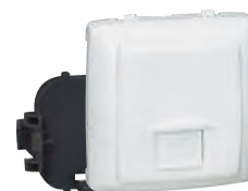
0 861 33

Mécanismes IP 2X protégés contre les contacts directs - 250 V~ Livrés bornes ouvertes. Finition blanc RAL 9003