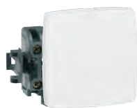
0 861 01