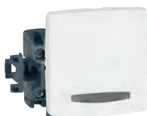
0 861 05