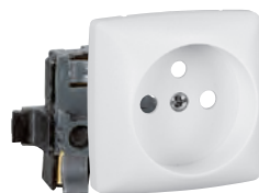
0 861 27