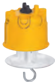
0 893 37