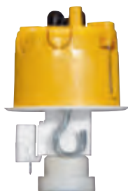
0 893 34