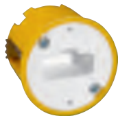
0 893 05