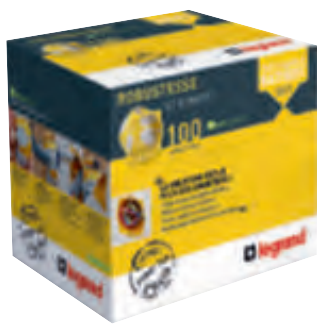
0 800 12

boîtes d'encastement pour cloisons sèches