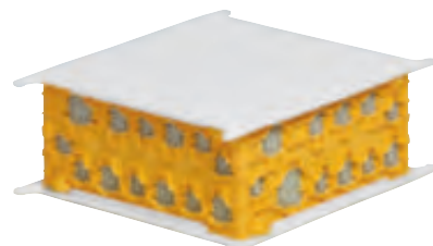
0 893 11