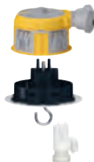
0 885 25