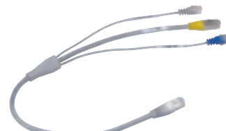
4 132 05

Principes d'installation et caractéristiques techniques p. 634-635