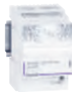
4 131 21