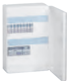
4 132 61