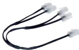
4 132 04