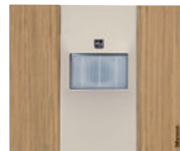
BTK4659 + enjoliveur Sable + plaque Chêne BTKA4802LM

Tableau de choix MyHOME p. 576 Tableau de choix enjoliveurs p. 617 à 618