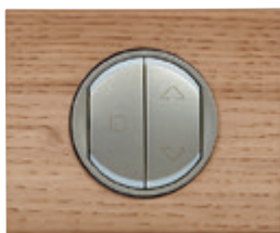
0 675 58 + enjoliveurs Titane + plaque Chêne Blanchi 0 690 51