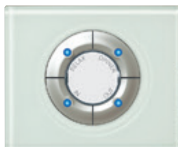
0 672 18 + plaque Verre Kaolin 0 693 11

Tableau de choix MyHOME p. 576 Tableau de choix enjoliveurs p. 617 à 618