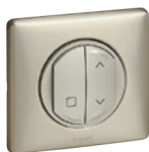
0 676 47L + plaque Titane 0 689 01