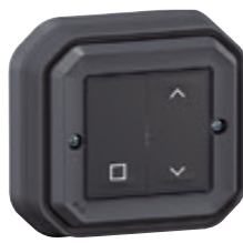
0 698 83L