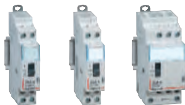
4 125 00