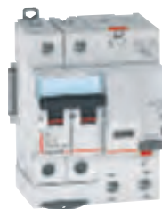
4 111 49