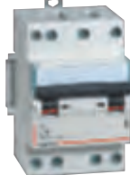
4 079 07