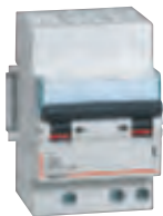
4 078 46