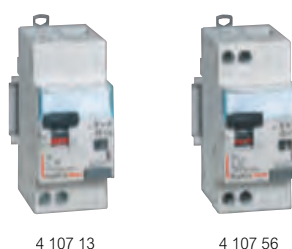
4 107 13