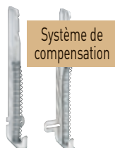
0 300 68 - 2 pieds sur ressorts livrés avec cache de finition