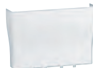
0 300 71