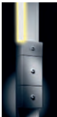
Couvercle à LED réf. 0 300 05 installé sur GTL