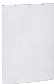
0 387 20