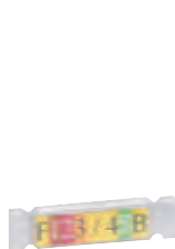
0 387 14 avec porte-repère 0 387 16