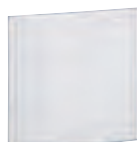
0 387 27

Impression et tenue garanties uniquement avec l'imprimante réf. 0 387 00 Utilisation intérieure