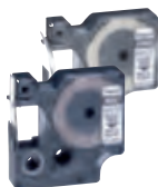
0 385 82/87