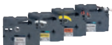
0 389 03/05/06/09