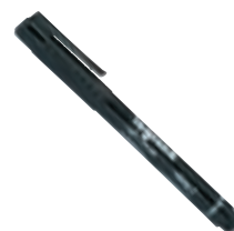
0 395 98

Caractéristiques techniques catalogue en ligne et p. 443