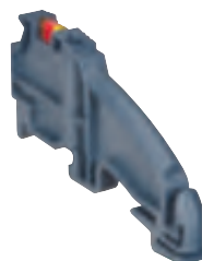
0 375 12 avec repérage CAB 3