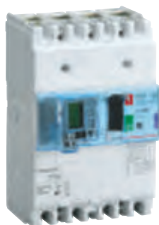
4 201 57