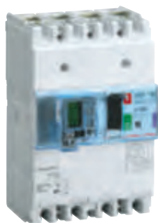
4 200 37