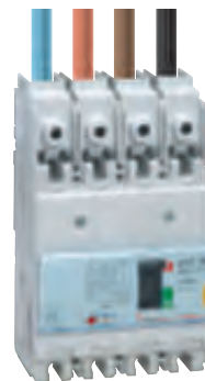
4 210 27