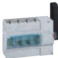
0 266 47