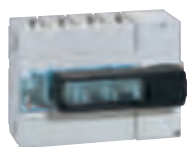
0 266 37