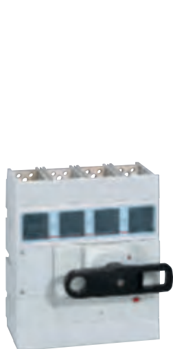
0 265 98

interrupteurs-sectionneurs 800 A à 1600 A