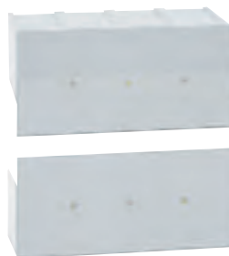
0 262 65

Caractéristiques techniques p. 375 Cotes d'encombrement catalogue en ligne