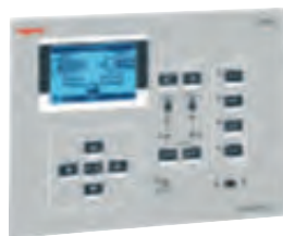
Boîtier d'automatisme réf. 4 226 83 (p. 370)