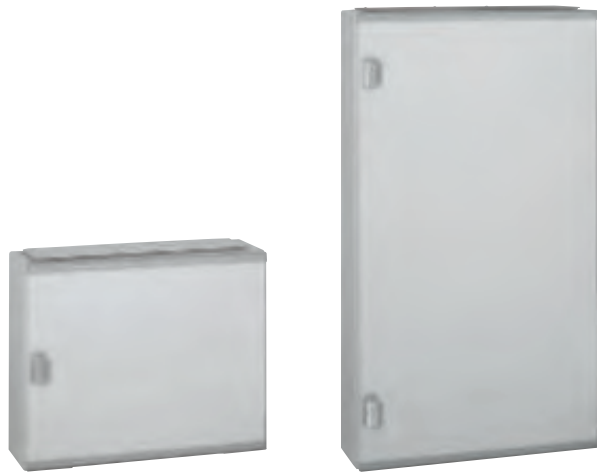
0 201 82