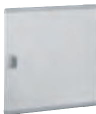
0 202 73