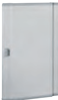
0 202 55