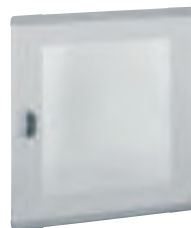
0 202 83