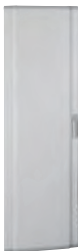
0 202 59