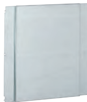
0 206 45