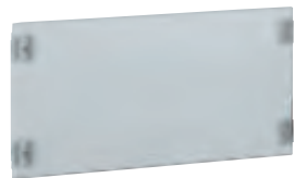
0 208 44