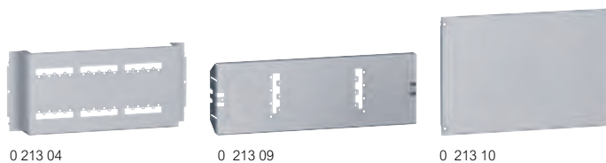
Tableau de choix des équipements p. 318

montage des DPX 3 250 HP magnétique seul