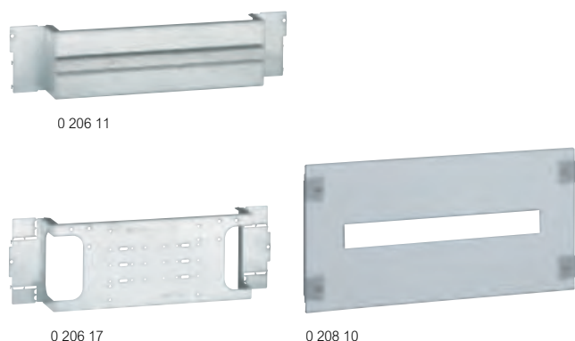
Tableau de choix des équipements p. 318

montage des DPX 3 160 et DPX 3 250 sur platines