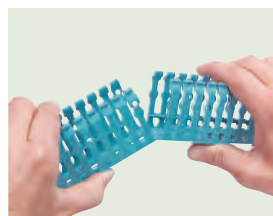
Goulotte sécable à la main