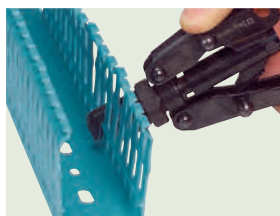
Sécabilité des languettes avec pince réf. 0 367 10