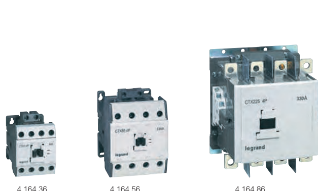
4 164 36