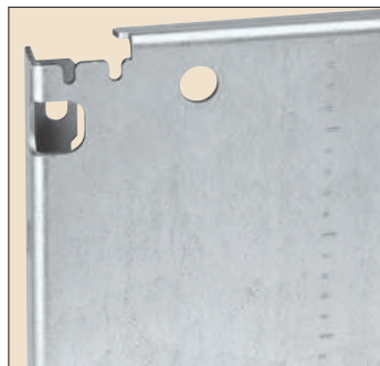
Prémarquage des plaques pleines et pleines largeur totale, et perçage pour levage