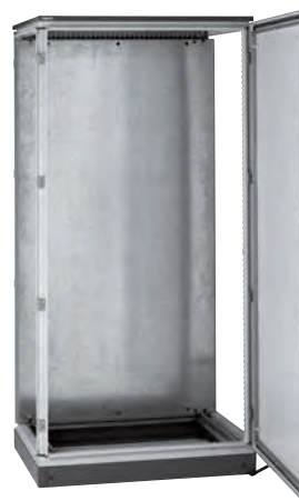
Exemple de plaque pleine largeur totale 0 475 15 montée dans une armoire assemblable

Caractéristiques techniques p. 210-211 Visserie p. 209