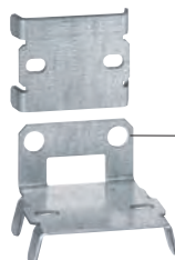
0 476 83